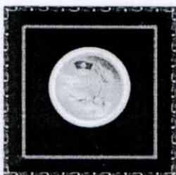
Медаль «ЛИДЕР КАЗАХСТАНА 2013»